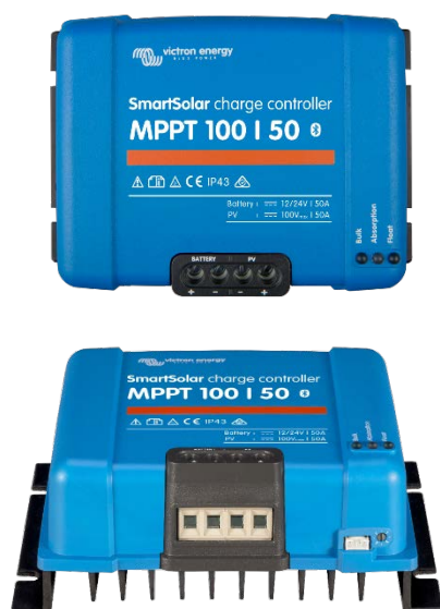
Controlador de carga SmartSolar MPPT 100/50