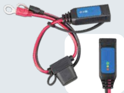
indicador de batería M8 ojales