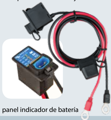
panel indicador de batería